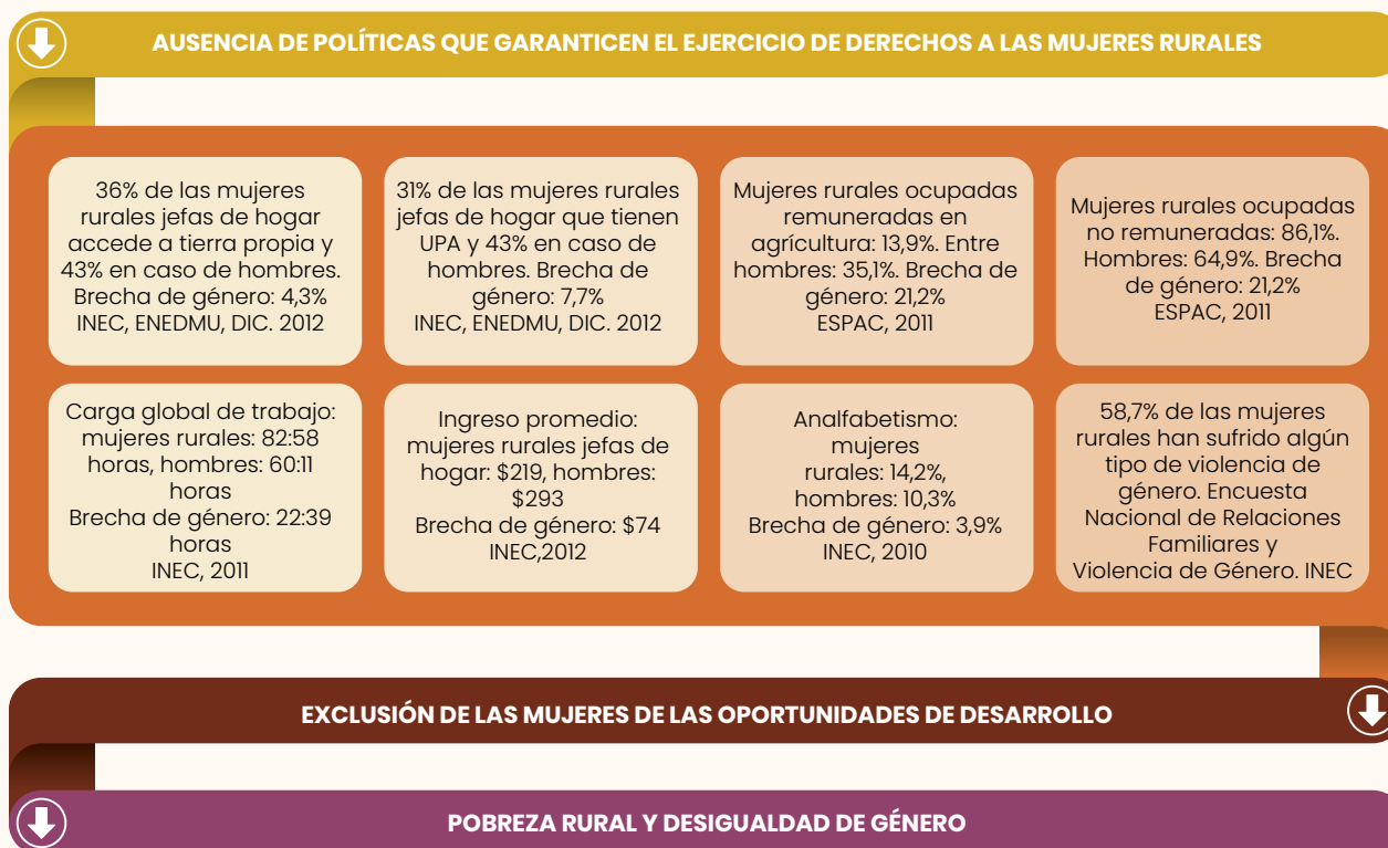
Gráfico 5. Principales brechas de las mujeres rurales para su desarrollo