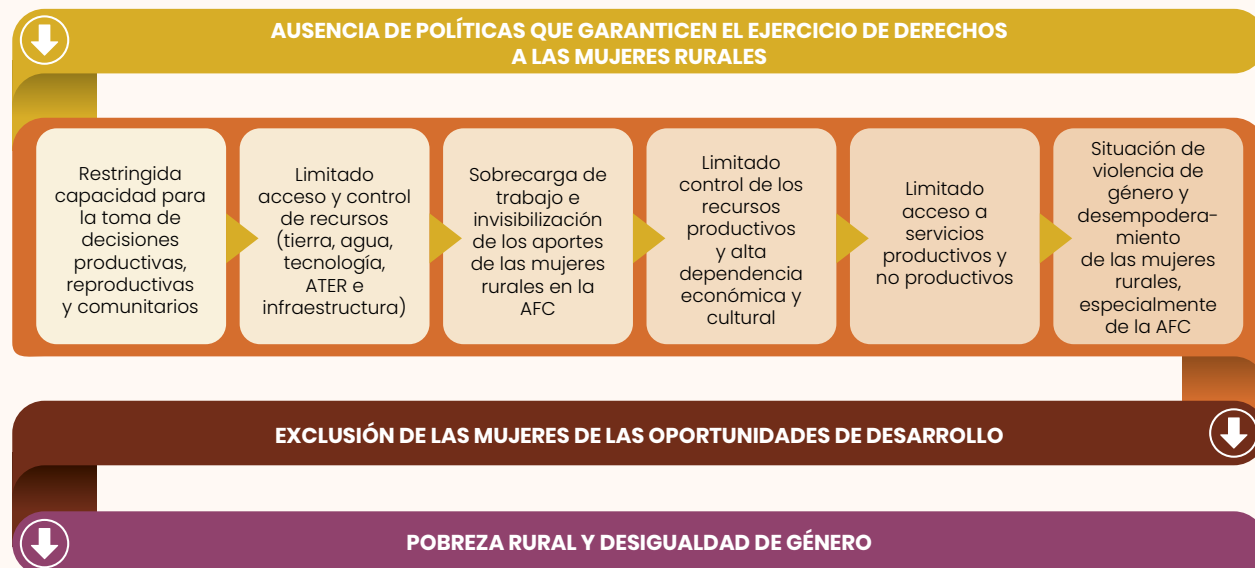
Gráfico 4. Principales barreras de género que afectan a las mujeres rurales del sector agropecuario