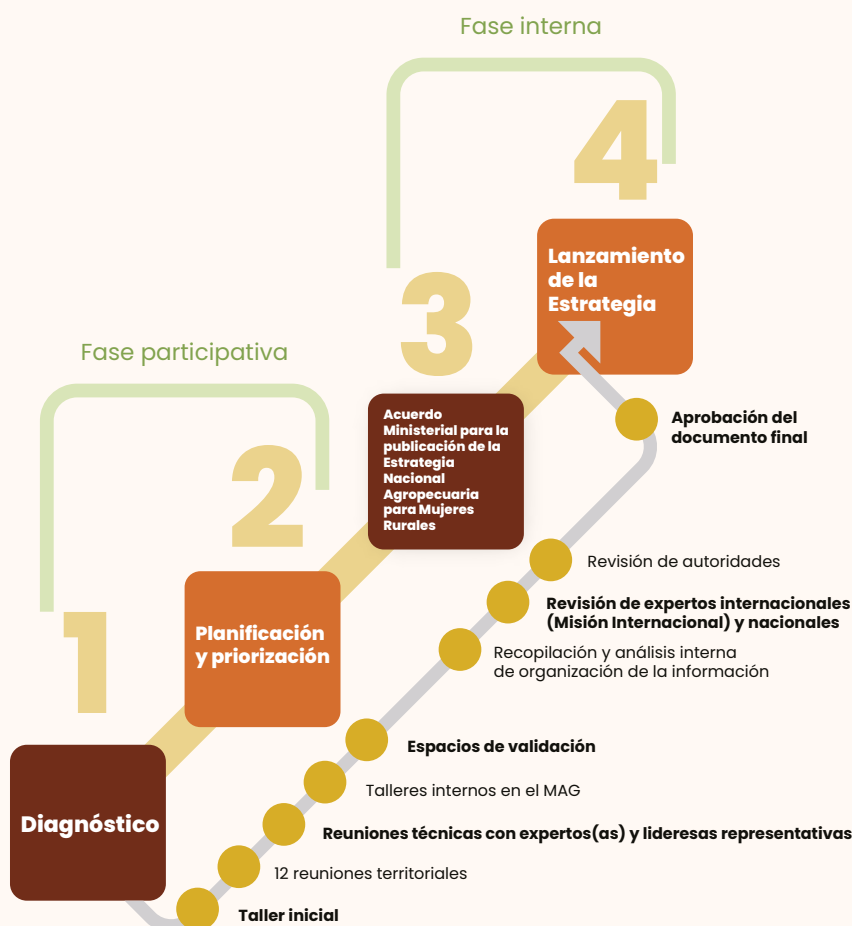
Gráfico 1. Proceso de construcción de la Estrategia Nacional Agropecuaria para Mujeres Rurales

El proceso para la construcción y lanzamiento de la Estrategia Nacional Agropecuaria constó de cuatro fases, las mismas que se detallan a continuación: